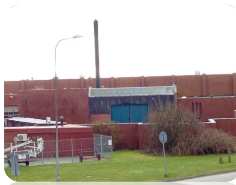
TIDL. SÆBY FISKEINDUSTRI - FABRIKSGRUNDEN