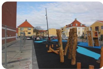
LEGEPLADS - SKAGEN 1