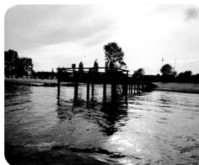
BADEBRO - FORSLAG