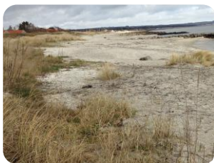
NORDSTRANDEN - BEVOKSNING

Desuden er der et stort ønske om etablering af cykelsti langs strandpromenaden hele vejen ud til Hedebo Camping, suppleret med den allerede eksisterende vej nogle steder. Turen langs stranden er attraktiv både for gående og cyklister, og strandpromenaden er ofte for trang og smal til begge.