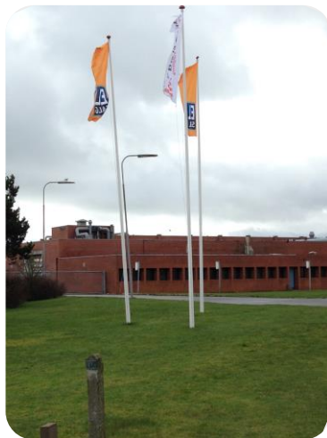
TIDL. SÆBY FISKEINDUSTRI - FABRIKSGRUNDEN

Nye boliger ønskes tilpasset og være i tråd med byggestil i den gamle bydel. I øvrigt henvises til forslag i Udviklingsplaner for Sæby Havn udarbejdet af Frederikshavn Kommune og borgere i efteråret 2009.