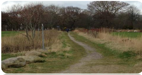
ADDA RAVNKILDES STI