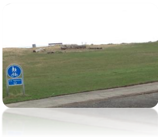
SÆBY ROKLUB AREAL - BÅLPLADS

Det foreslås opstilling af udendørs motionsredskaber - i lighed med motionsredskaber placeret ved Sundhedshuset i Sæby. Det vil være et særdeles godt aktiv for gæster der kommer på stranden, motionister, m.fl. Der kan evt. opsættes en hoppeborg til børnene om sommeren. Den eksisterende bålplads bevares.